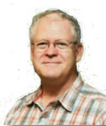
Par Jean-Marie Marquis

Devise : MARQUIS, NOBLES DE CŒUR fait allusion à la générosité, la bienveillance, l'indulgence et la gentillesse des membres de la famille.