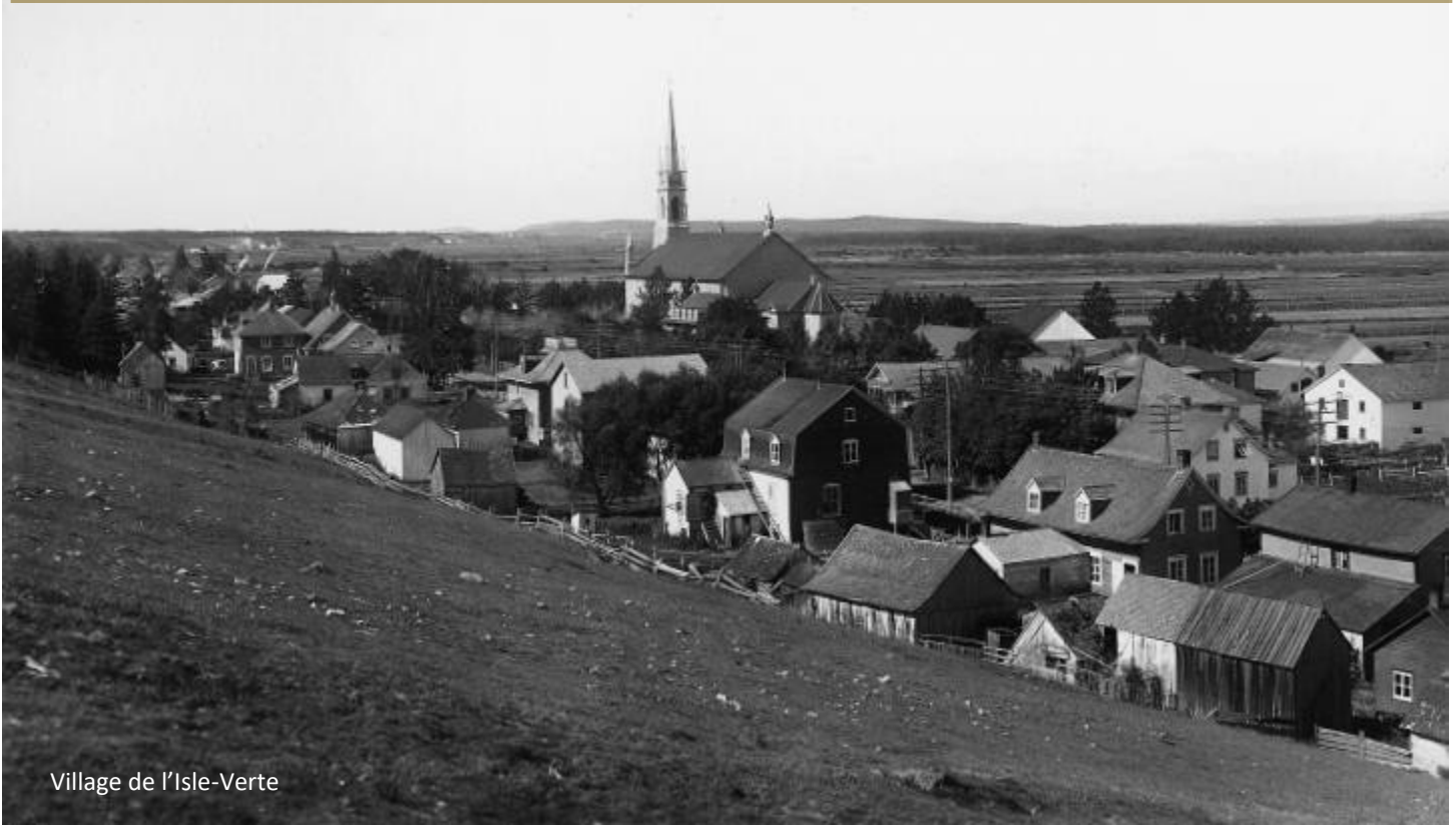
Village de l'Isle-Verte

Plus précisément : Village des Frisés, p'tit village, Village à Blaye, du Bois des Bel à la route de la rivière des Vases